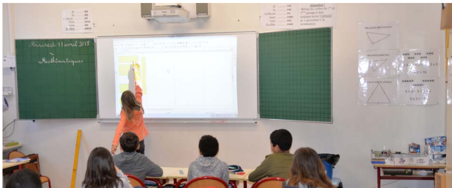
La modernisation du réseau permet de connecter les écoles du SIVU au très haut débit.

À partir de sa vocation de télédistribution, le SIVU a permis la modernisation des communes et à tous ses habitants de bénéficier de ce qu'il se fait de mieux en termes de haut débit numérique.